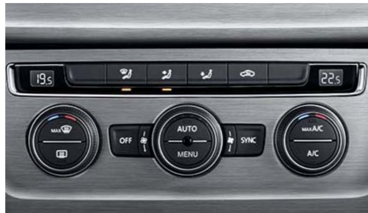
Climatisation automatique 'Climatronic' bi-zone