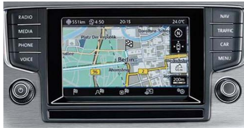
Système Navigation Infotainment 'Discover Media'