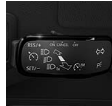
Régulateur et limiteur de vitesse